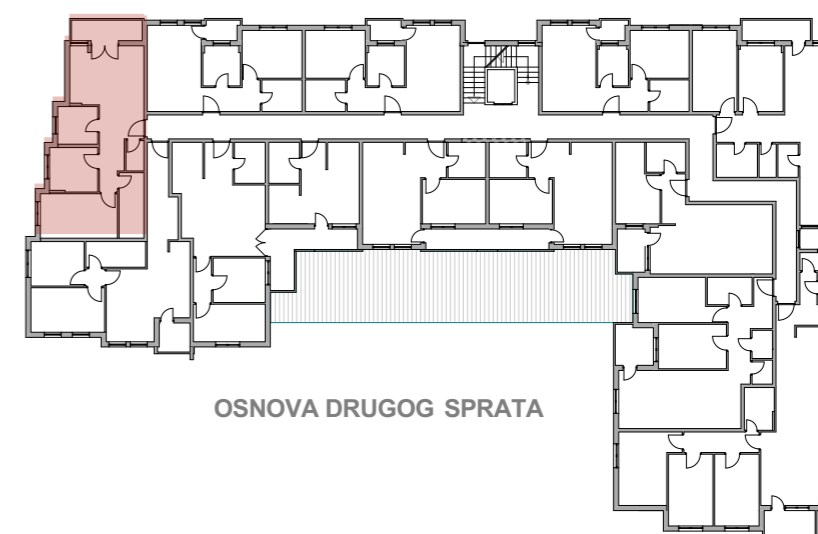
OSNOVA DRUGOG SPRATA